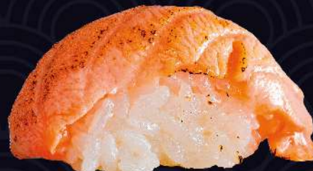
SALMÃO SELADO com tarê e gergelim