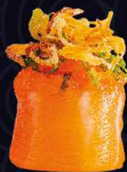
ALHO PORÓ salmão picado e alho poró