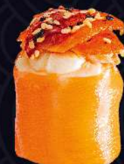
SKIN com cream cheese