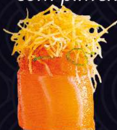
CRISPY de batata doce