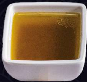
FLOR DE SAL COM AZEITE