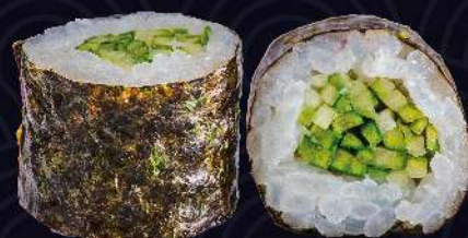
Kapa Maki pepino