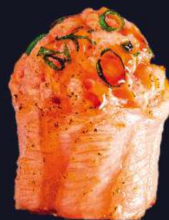
SALMÃO salmão picado selado no maçarico com molho tarê