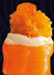
CAMARÃO EMPANADO com cream cheese e geleia de pimenta