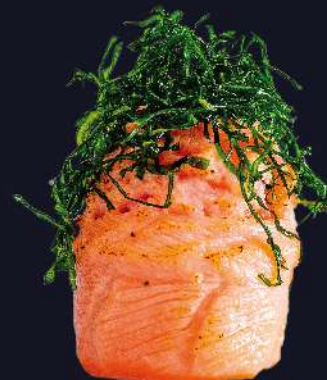
COUVE salmão picado selado no maçarico e couve desidratada