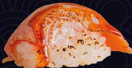
ATUM SELADO com tarê e gergelim