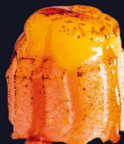
BRIE selado no maçarico com molho tarê