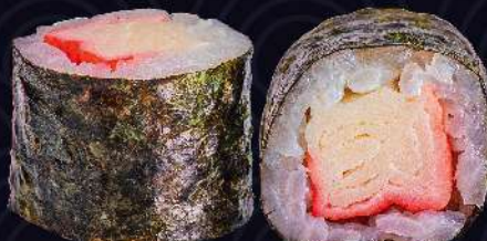
Kani Maki kani