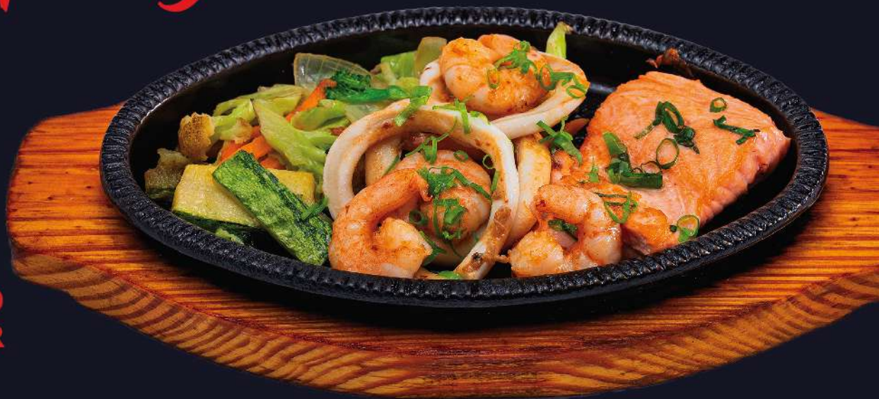
FRUTOS DO MAR