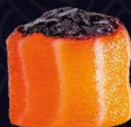
GELEIA de amora