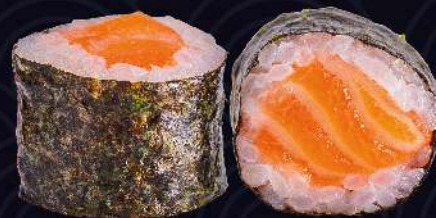
Shake Maki salmão