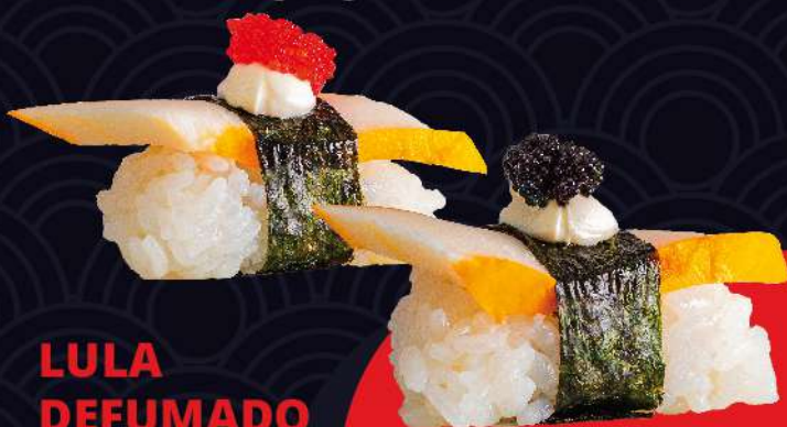
LULA DEFUMADO com ovos red ou black