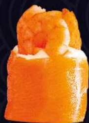
CAMARÃO com cream cheese