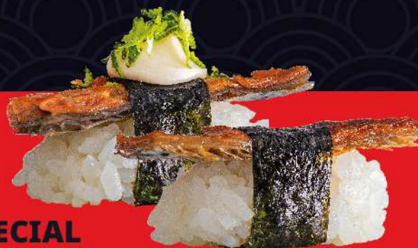
SKIN ESPECIAL com cream cheese e raspas de limão ao molho tarê