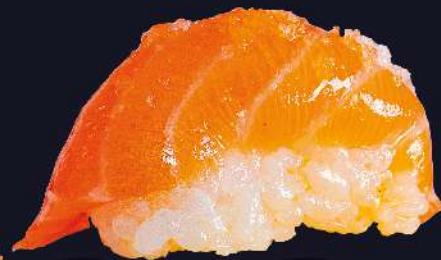
SALMÃO COM FLOR DE SAL e azeite trufado