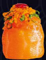
MEXICANO com molho de pimenta e nachos