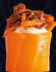
SHIMEJI com cream cheese