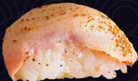
ATUM SELADO com tarê e gergelim