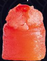
ATUM ESPECIAL com pimenta