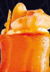
AMÊNDOAS com cream cheese e molho tarê