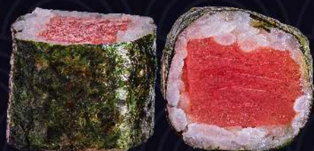
Tekka Maki atum