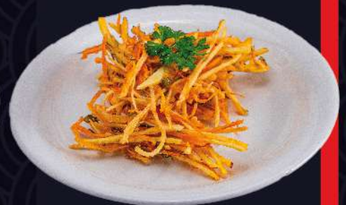
KAKIAGUE legumes empanados